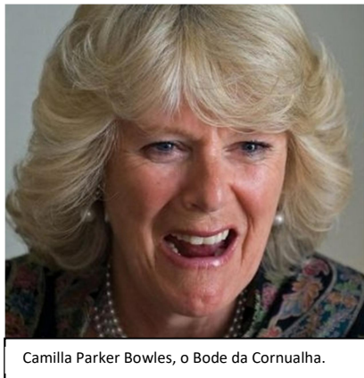
Camilla Parker Bowles, o Bode da Cornualha.